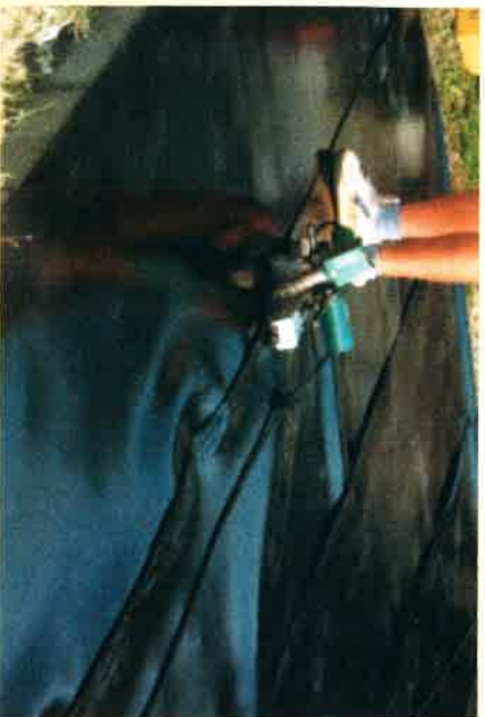
Zdroj: Jiránek, M.: Izolácie proti radónu