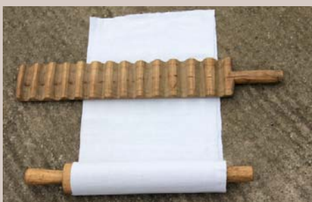
Foto - prvé muzeálne exponáty...