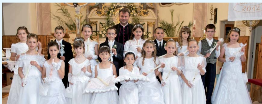
1. sväté prijímanie - 3. júna 2012